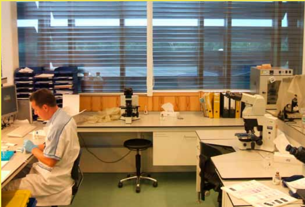
Multifilm rolgordijnen in het laboratorium van het Deventer Ziekenhuis.